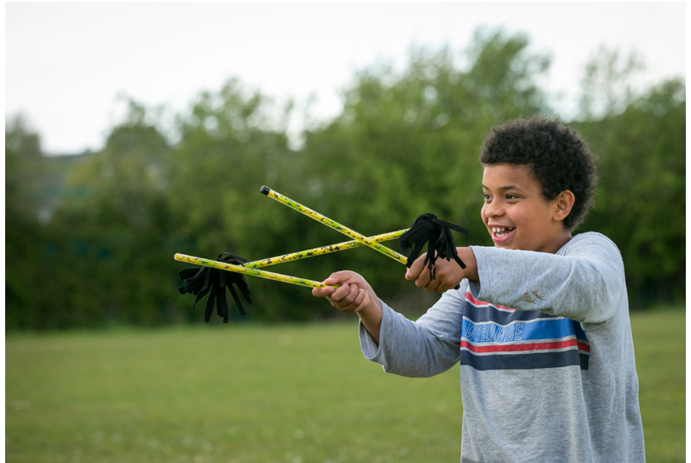
Rannpháirtí Shorcas Pobail na Gaillimhe ag súgradh le maidí blátha