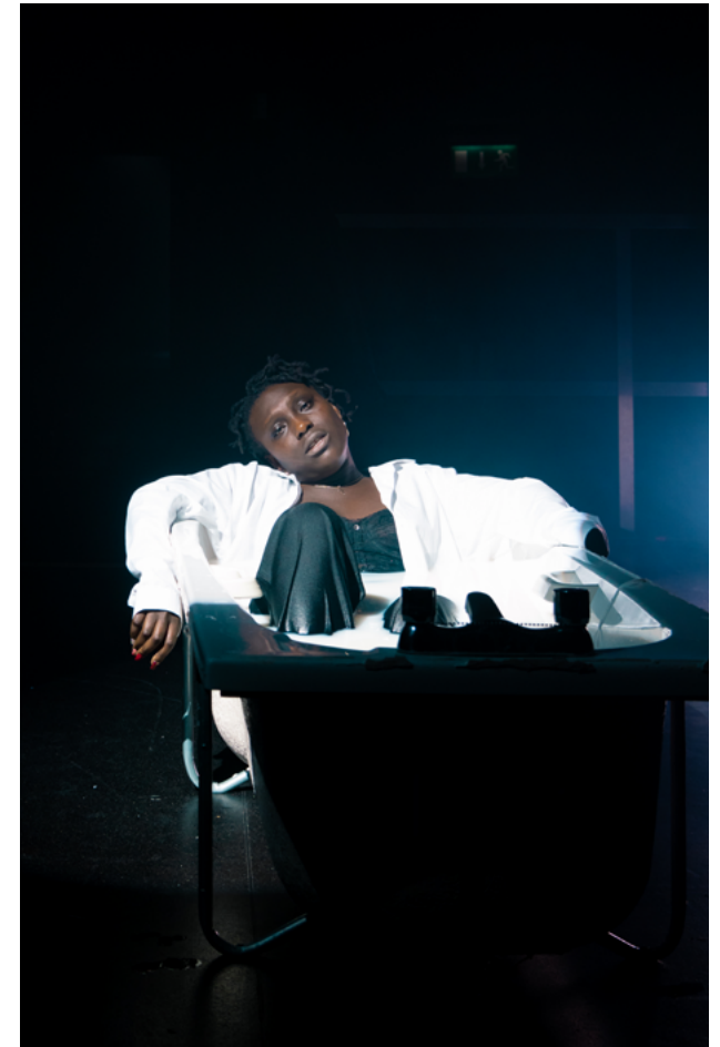
Felispeaks, Spotlight, Meitheamh 2021 Ionad Ealaíon Project

Chun ealaíontóirí a tharraingt isteach i bhforbairt an bheartais, chruthaíomar buiséad le cinntiú go n-íocfaí na healaíontóirí as a gcuid ama. Anuas air sin, chuireamar lenár mbuiséid i gcomhair rochtana, oiliúint foirne, R&D (an Máistirphlean) agus clár Acmhainne Project. Léirítear ár bprionsabail agus ár dtosaíochtaí TEDI sa mhaoiniú le haghaidh coimisiúin nua freisin.