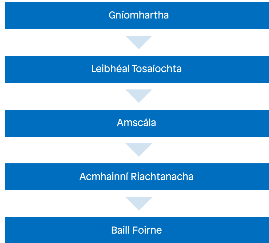
Figiúr 1: Léaráid ar Thús Áite a Thabhairt do Phríomhghníomhaíochtaí

→ Íoslódáil agus comhlánaigh an Teimpléad de Bhunghníomhartha in MS Word