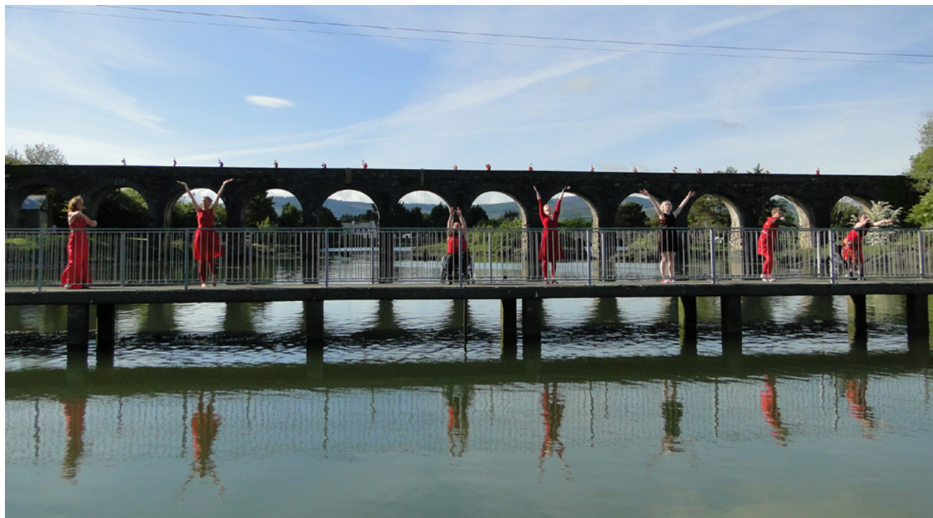
Bridge le Croí Glan 2014