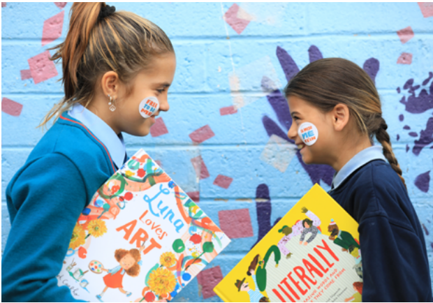
Daltaí de chuid Scoil Mhuire Naofa, Sráid Dorset ag seoladh an tionscadail Free To Be Me de chuid Leabhair Pháistí Éireann